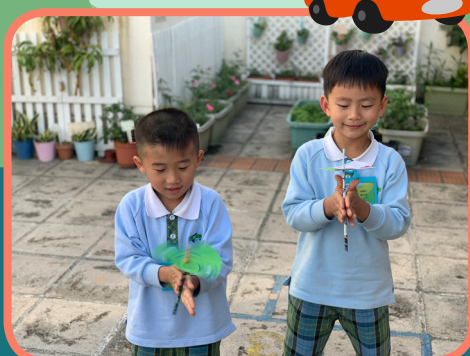
幼兒在試玩紙製竹蜻蜓，很有成就感呢！