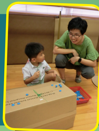
幼兒正與家長分享，紙皮屋的製作方法。